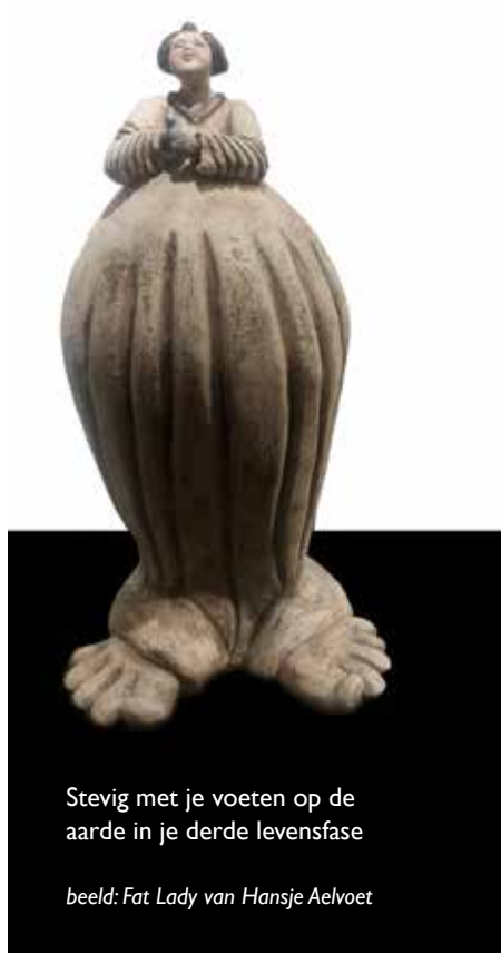
Stevig met je voeten op de aarde in je derde levensfase

Heb je interesse in deze cursus maar passen de data niet. Laat het me weten, bij voldoende aanmeldingen plan ik een tweede cursus op andere data.